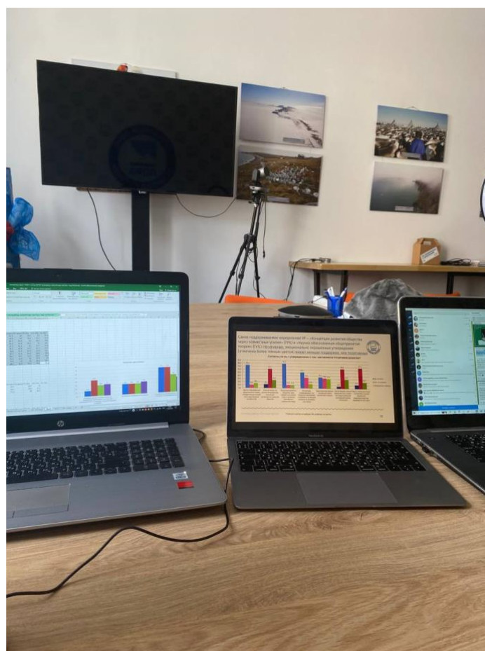
Рис. 4. Анализ данных социологического опроса

Совсем недавно меня утвердили на позицию стажера в Консалтинговое агентство YOU SOCIAL, которое создает стратегии и политики в области устойчивого развития,