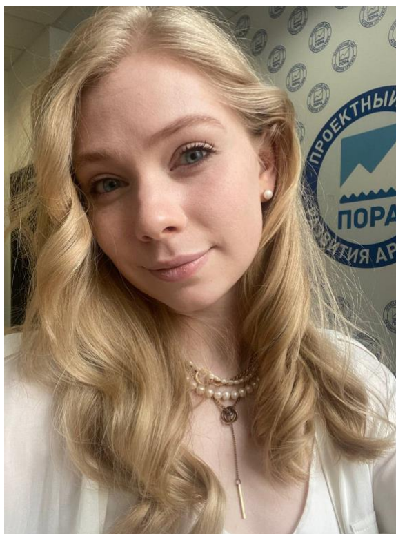
Рис. 3. Первый день практики